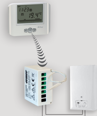
Esempio di collegamento con un attuatore remoto a 1 canale