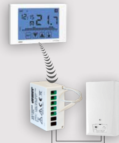
Esempio di collegamento con un attuatore remoto a 1 canale